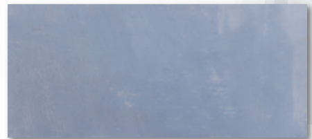
カラー型番 : 006