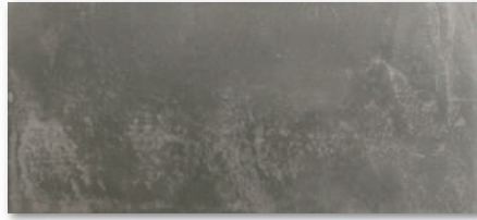
カラー型番 : 002