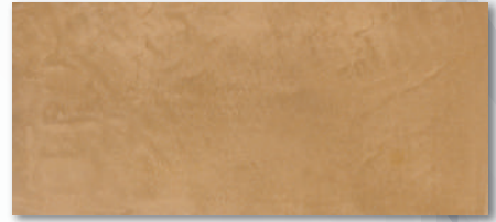
カラー型番 : 003